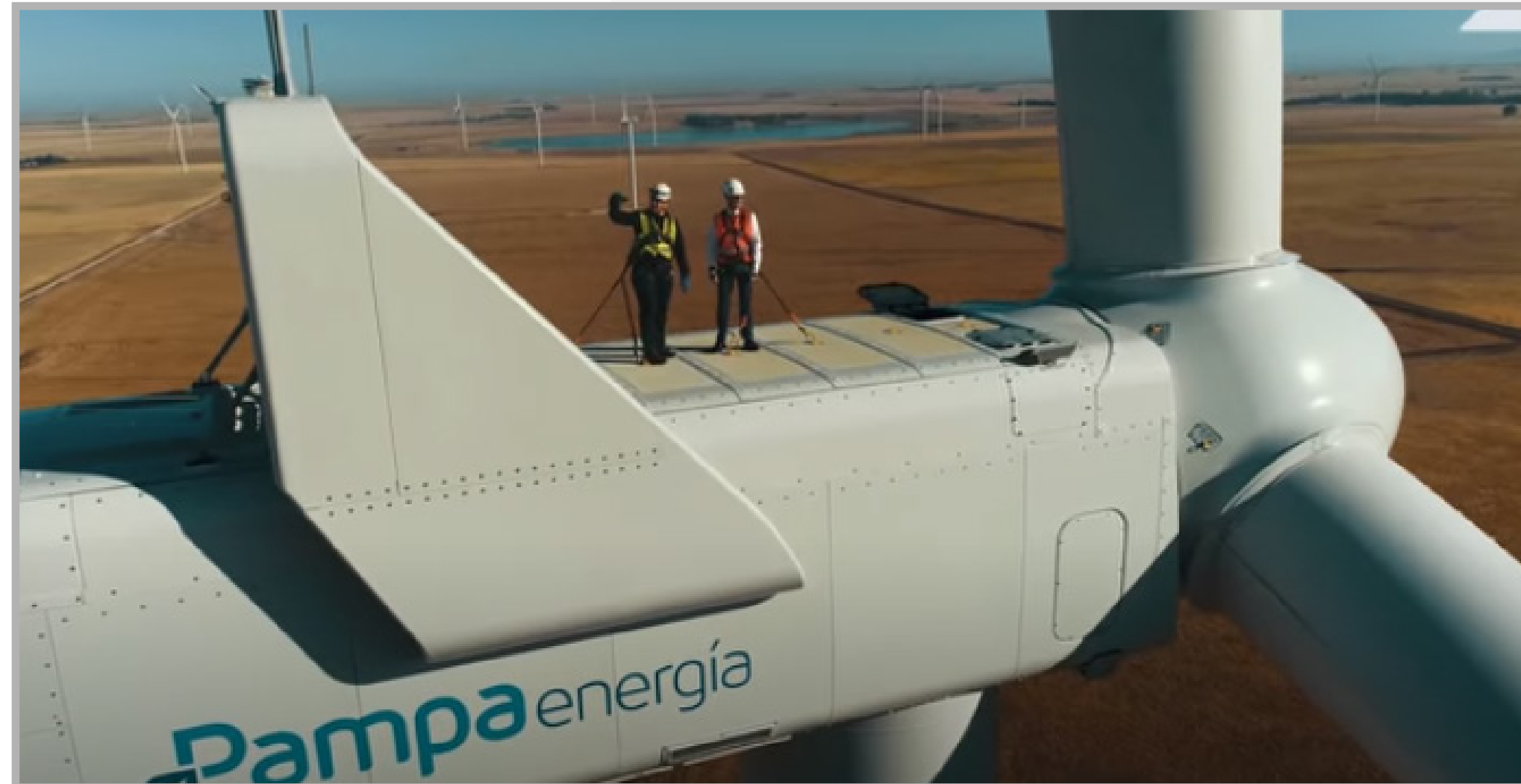
Pampa | Energía Argentina